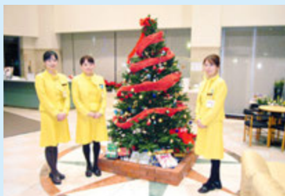
インフォメーションとコンサルジュの皆さん