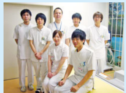
画像検査科の皆さん