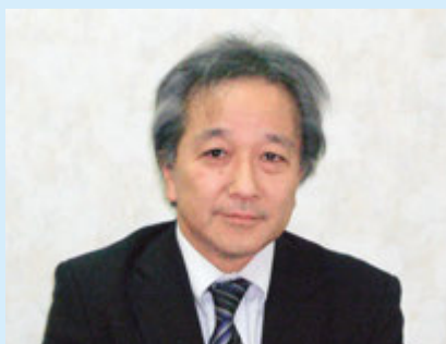
渡邊好孝 教育部部長