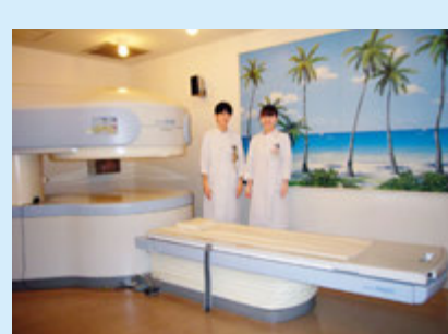
APERTO Inspireとスタッフの皆さん