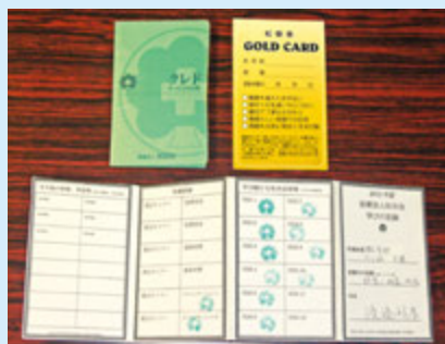
クレドの携帯冊子と研修記録