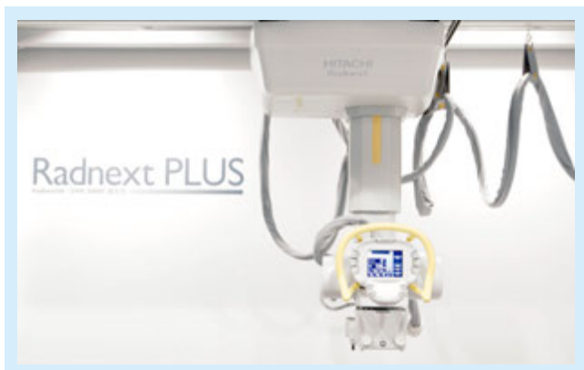
図1：天井走行式管球保持装置SX-A300の外観

一般X線撮影装置は、洋の東西を問わず用いられる基本的な画像診断装置の1つである。整形外科領域における専門的