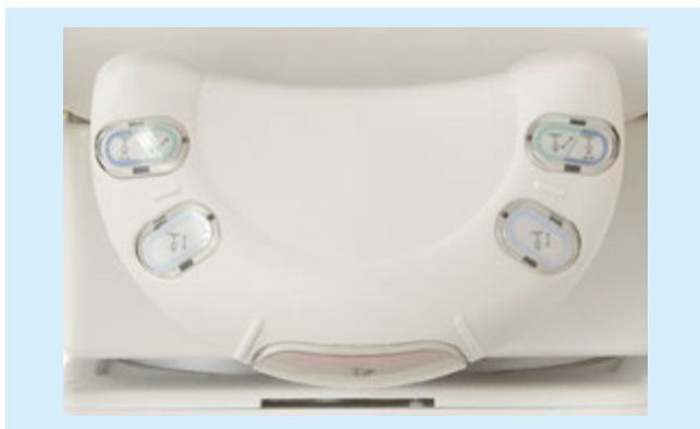
図5：ワンハンド操作器

う場合があった。同様に、認知症の被検者は電磁ロック音に驚いて、天井を見上げるなど動いてしまうことがあった。また、微妙なポジショニングでは、何回も続けて電磁ロック音が鳴るため、被検者からクレームを言われることがあった。