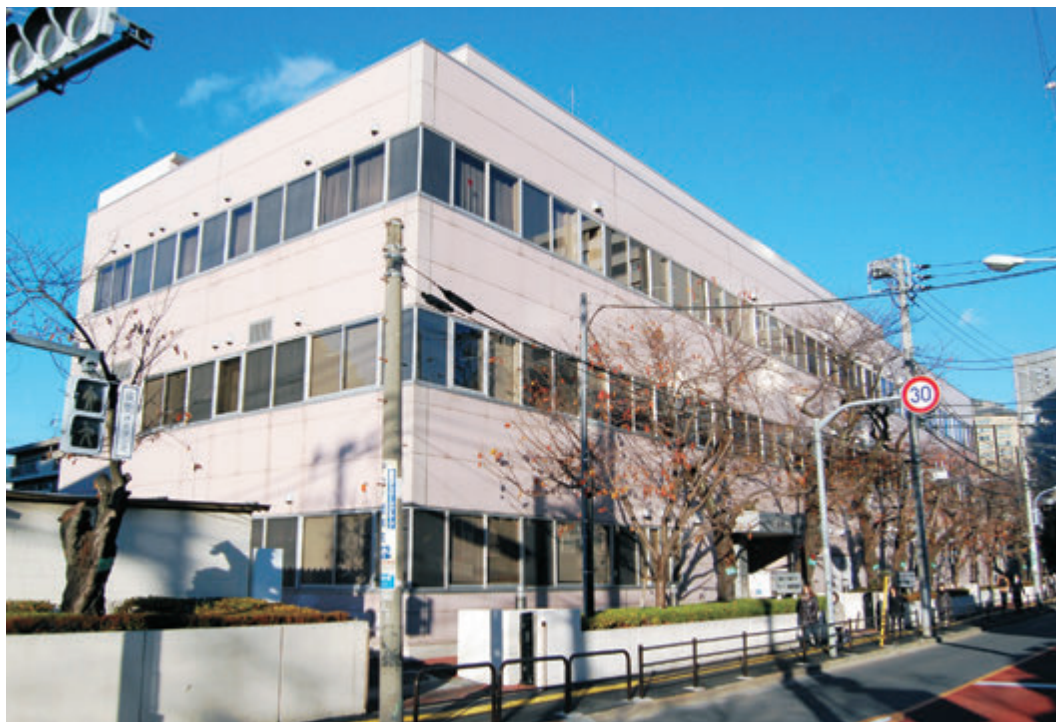
東京女子医科大学附属膠原病リウマチ痛風センター 外観