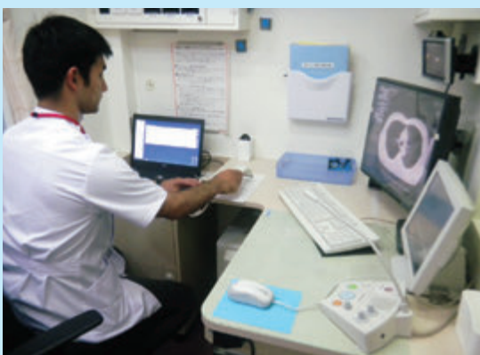
CT検診車2号車(16列CT)の操作卓