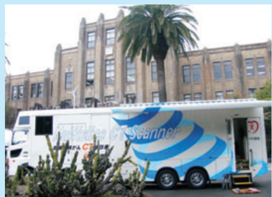
CT検診車2号車(宮崎県庁での検診車出発式にて)