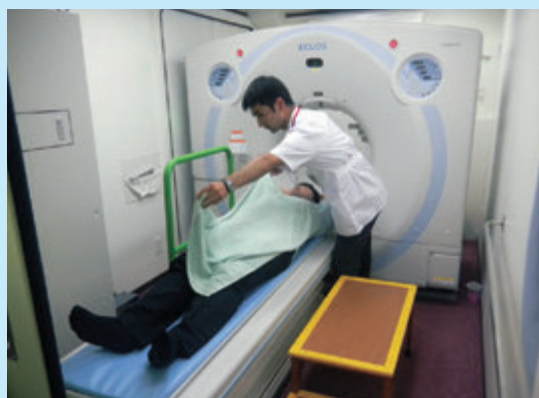
CT検診車2号車(16列CT)の撮影室