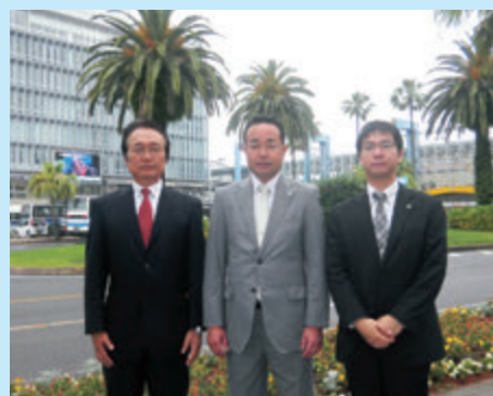
筆者(左)、小川宮崎営業所長(中)、高橋CTMR専任営業(右)