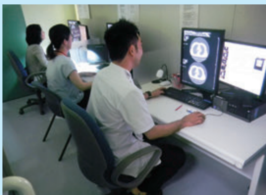
読影室(健診センター内)