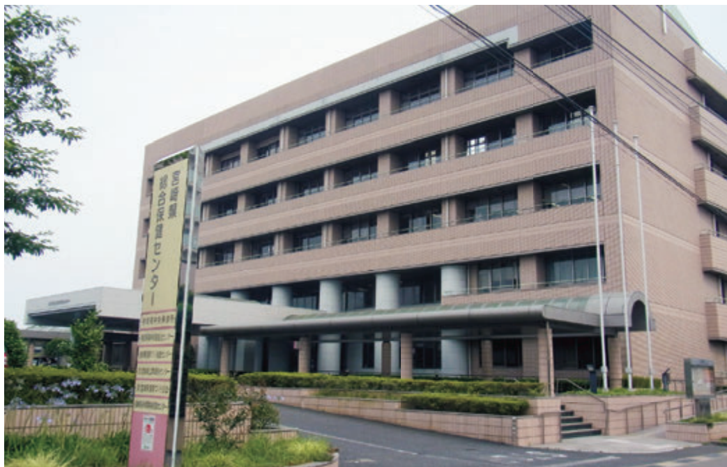
宮崎県健康づくり協会 外観